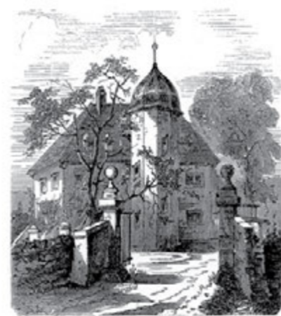
Wolfs Rigid's Quat.

Klima, um deswillen wir mit gutem Recht die Löbnitz als ein Asyl für Reconvallescenten bezeichnen durften und auch empfehlen.